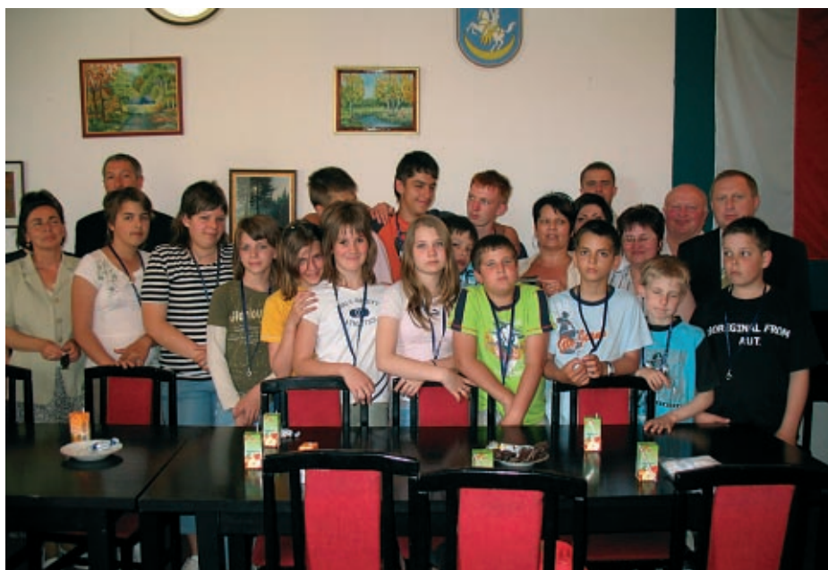
Grupa nastolatków z Węgier z wizytą w Urzędzie Gminy Tarnów.

W trakcie pobytu w Gminie Tarnów węgierscy uczniowie odbyli zajęcia integracyjne i edukacyjne wraz ze swoimi polskimi rówieśnikami, uczyli się węgierskich i polskich piosenek i tańców, uczestniczyli w zajęciach plastycznych, sportowych i komputerowych. W ramach poznawania wspólnego dziedzictwa węgierscy uczniowie odbyli spacer po Tarnowie śladami bohatera walk o wolność Polski i Węgier, tarnowianina, gen. Józefa Bema. Mieli także okazję zwiedzić Kraków, Wieliczkę, rezerwat „Skamieniałe Miastecz-