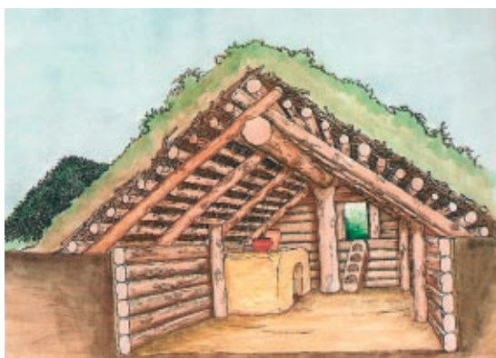
Rekonstrukcja słowiańskiej ziemianki z IX-XI wieku. (Rys. Andrzej Michta)

W trakcie wspomnianych wcześniej wykopalisk na terenie grodziska zbadano około pięćdziesięciu budynków z wczesnego średniowiecza, kilkanaście palenisk i jam wykopanych na osadzie. Wiemy, że zabudowa na rozległych podgrodziach nie była zbyt gęsta: sporo było wolnego miejsca dla mieszkających w okolicznych wsiach. Domostwa były bardzo różne: od kwadratowych ziemianek z kamiennymi piecami w narożnikach, przez naziemne budynki o plecionkowych ścianach, aż po pojedynczą chatę zrębową, wyróżniającą się bogactwem znalezisk w zgłiszczach. W trakcie wykopalisk na grodzisku uzyskano ponad dwadzieścia tysięcy (sic!) fragmentów naczyń z IX-XI w. oraz kilkadziesiąt zabytków żelaznych (m.in. ostrogi, groty strzał, noże, krzesiwa, liczne noże). Znaleziono również fragment szklanego paciorka o bizantyjskich nawiązaniach. Datowanie licznych zabytków pozwala przyjąć, iż gród istniał od IX w., a więc powstał w czasach plemienia Wiślan. Przetrwiał burzliwe w Małopolsce czasy X stulecia i najpewniej pierwsze lata przynależności tych ziem do państwa polskiego. W początkach XI w. został zniszczony i szybko zapomniany. Historycz-