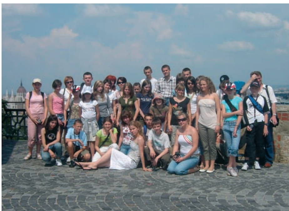
Grupa młodzieży z Tarnowca i Łękawki z wizytą na Węgrzech.