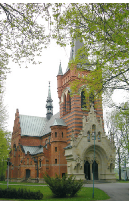
Kościół św. Piotra i Pawła Poręba Radlna

Wizytówką tej miejscowości jest okazały neogotycki kościół parafialny stojący na wzgórzu. Bardziej zainteresowani historią wiedzą, że nie jest to pierwszy kościół w tej miejscowości, a poprzedni nie stał w tym samym miejscu. Po raz pierwszy nazwa Poręba Radlna pojawiła się w 1392 roku w akcie sprzedaży tej wsi przez Dzieńslawa, syna sędziego ziemskiego sandomierskiego Pelki, na rzecz Jana z Tarnowa.