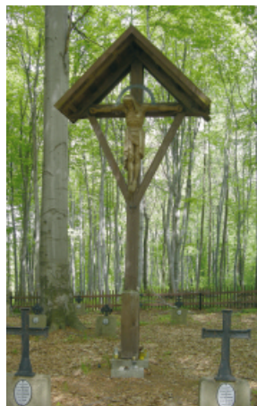
Poręba Radlna cmentarz z I w.ś nr 175