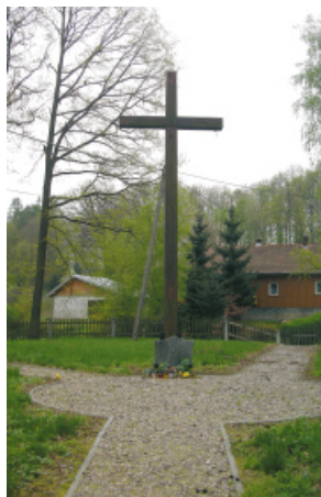
Krzyż na górze za szkoła Poręba Radlna