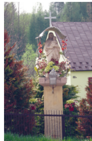
Figura z 1862 Poręba Radlna