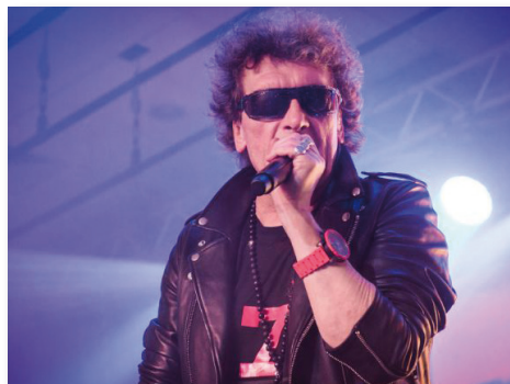
Na dożynkach usłyszymy zespół LADY PANK

Nie sposób sobie wyobrazić gminę Tarnów bez sierpniowych dożynek. Dwudniowe świętowanie w Zbylitowskiej Górze to dziełczynna modlitwa, ludowe obrzędy, swojskie jado i przede wszystkim moc atrakcji dla każdego. Przygotujmy się na prawdziwą hulankę, na którą zaprosi nas Kordian ze swoją „Dziewczyną z gór”. Nic tak nie poderwie do tańca, jak góralska nuta z rytmem disco. Następnego dnia usłyszymy „Zawsze tam, gdzie Ty”, czyli łączy pokolenia Lady Pank i ich największe przeboje – „Tacy sami”, „Na co komu dziś”, „Mniej niż zero”. Pamiętajmy – sierpień