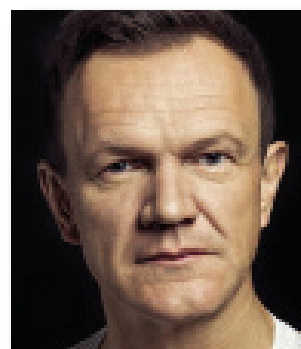
Wystąpi kabaret Cezary Pazura