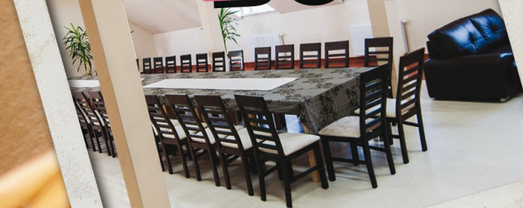
Dom Ludowy w Radlnej z salą konferencyjną i nowoczesnie urządzonej częścią noclegową