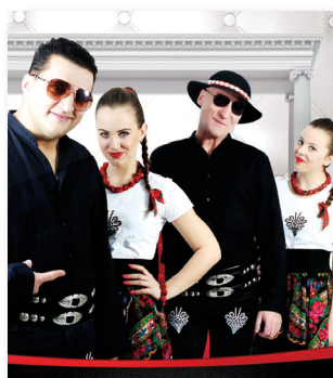
Zagra zespół disco-polo KORDIAN

2018 – bo przecież Trzeba zawsze żyć biegnącą chwilą.