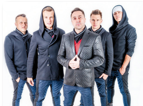
Do wspólnego świętowania zaprosi zespół disco-polo BOYS