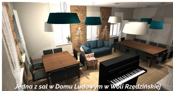
Jedna z sal w Domu Ludowym w Woli Rzędzińskiej

podstawowych. Nowe pomieszczenia przystosowane zostaną dla potrzeb przedszkolaków. Przy szkole w Zawadzie dodatkowo powstanie parking dla samochodów. W Szkole Podstawowej w Zbylitowskiej Górze wymieniona zostanie instalacja centralne-