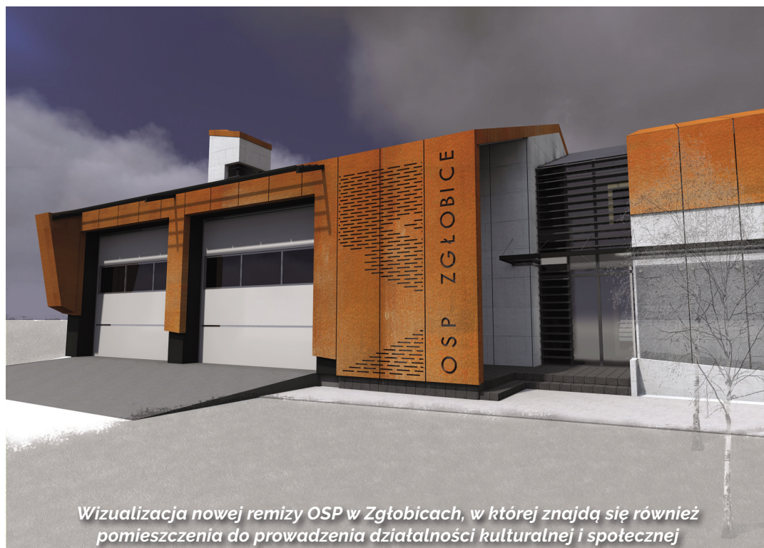
Wizualizacja nowej remizy OSP w Zgłobicach, w której znajdą się również pomieszczenia do prowadzenia działalności kulturalnej i społecznej

Warto dodać, że do dyspozycji sołectw przeznaczono w tym roku 1 mln zł – środki te rozdysponowali mieszkańcy podczas zebrań wiejskich.