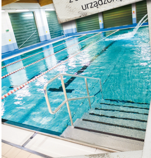
Centrum Rekreacji Wodnej w Woli Rzędzińskiej basen, sauna, siłownia