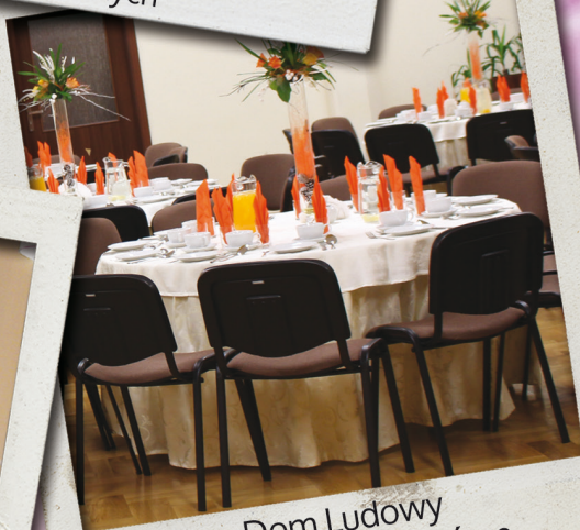
Dom Ludowy w Zbylitowskiej Górze z salą konferencyjną