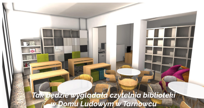
Tak będzie wyglądała czytelnia biblioteki w Domu Ludowym w Tarnowcu

W Błoniu i Zawadzie dokończona zostanie rozbudowa szkół