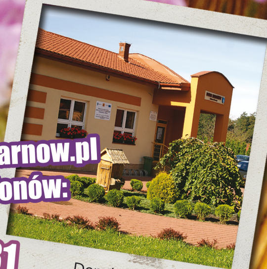
Dom Ludowy w Nowodworzu

Szczegóły na www.gmina.tarnow.pl lub pod numerami telefonów: