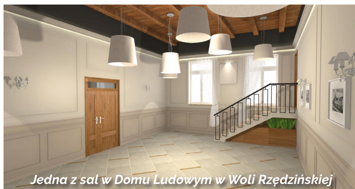
Jedna z sal w Domu Ludowym w Woli Rzędzińskiej

go ogrzewania, a wokół obiektów szkolnych w Koszycach Wielkich zakończona wymiana ogrodzenia. Zagwarantowane są w budżecie gminy pieniądze na szereg