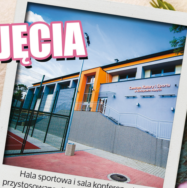
Hala sportowa i sala konferencyjna przystosowana dla ok. 50 osób z zapleczem kuchennym w Centrum Kultury i Sportu w Koszycach Małych