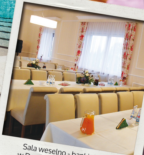
Sala weselno - bankietowa w Domu Ludowym w Radlnej przystosowana na przyjęcie ok. 120 osób