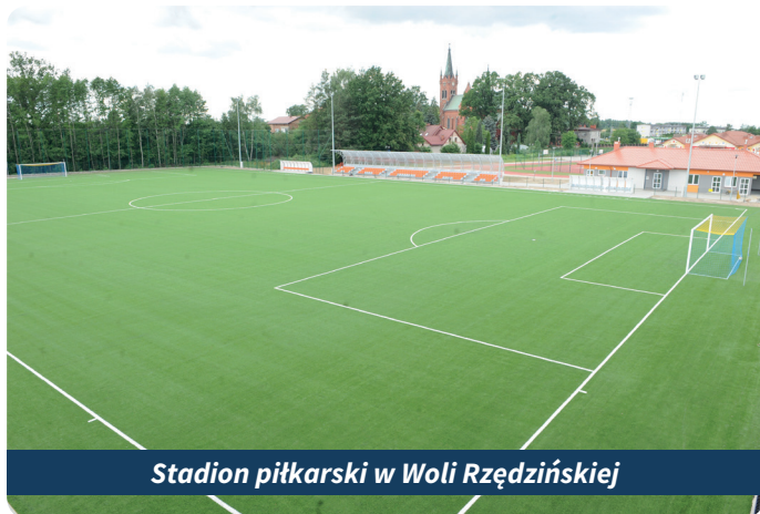
Stadion piłkarski w Woli Rzędzińskiej

Gmina Tarnów pozyskała również 17 tys. zł w ramach konkursu „Kapliczki Małopolski” na remont kamiennej kapliczki Dzieciątka Jezus w Błoniu.