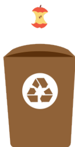
ODPADY BIODEGRADOWALNE (ZIELONE)