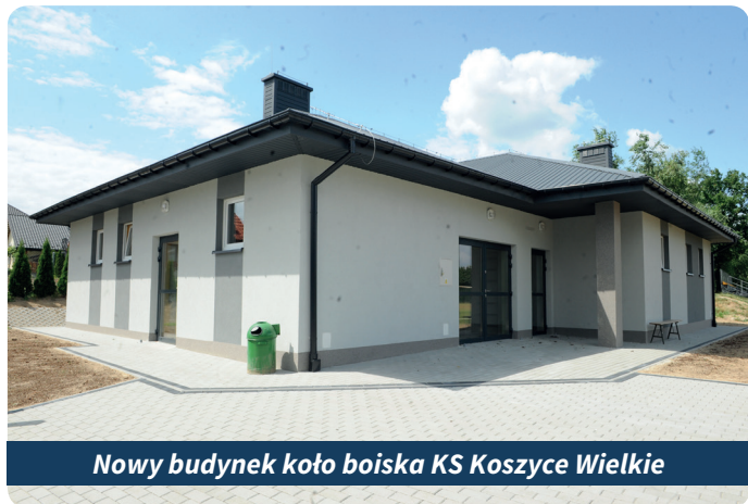
Nowy budynek koło boiska KS Koszyce Wielkie