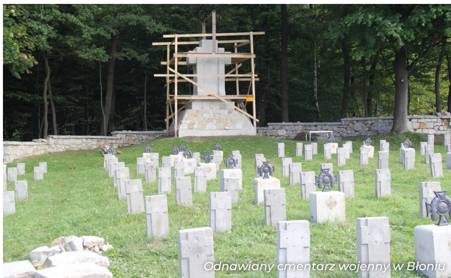
Odnawiany cmentarz wojenny w Błoniu

Dobiegł również końca remont drogi gminnej ul. Skotnik w Zbylitowskiej Górze. Na długości prawie 1,5 km została położona nowa nawierzchnia asfaltowa, a odcinek modernizowanej ul. Zielnej zyskał poszerzenie pasa drogowego i nowe pobocza. Ogółem koszt inwestycji wyniósł ponad 600 tys. zł, w tym dofinansowanie z Rządowego Funduszu Rozwoju Dróg to ponad 427 tys. zł. Z tego samego rządowego funduszu samorząd gminy Tarnów uzyskał wsparcie finansowe w wysokości przeszło 226 tys.