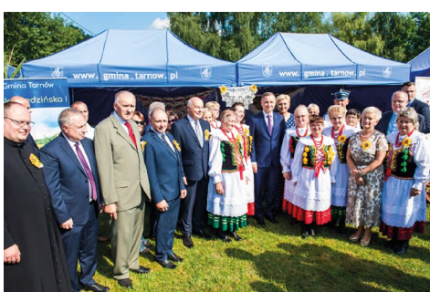
Wola Rzędzińska I