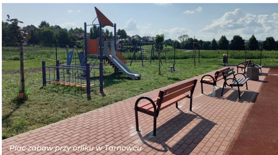
Plac zabaw przy orliku w Tarnowcu

Za kwotę około pół miliona złotych są wykonywane na terenie poszczególnych miejscowości nakładki asfaltowe. Nowe drogi łącznie o długości około 2 km wykonywane są w dwóch warstwach w celu uzyskania większej wytrzymałości i lepszej jakości nawierzchni.