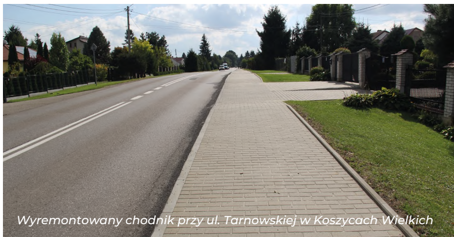
Wyremontowany chodnik przy ul. Tarnowskiej w Koszycach Wielkich

Zakończony został remont kolejnego odcinka chodnika przy głównej drodze powiatowej w Koszycach Wielkich (do skrzyżowania z ul. Szkolną) za kwotę ponad 35 tys. zł. wraz z remontem odcinka chodnika przy tej samej drodze powiatowej w Koszycach Małych (od skrzyżowania z ul. Skalną w kierunku Rzuchowej) – 41 tys. zł. Kontynuowanie remontu i przebudowy kolejnego (już ostatniego) odcinka chodnika w kierunku Rzuchowej planowane jest w przyszłym roku po ukończeniu projektu budowlanego i uzyskaniu stosownych pozwoleń oraz zabezpieczeniu środków finansowych na ten cel.