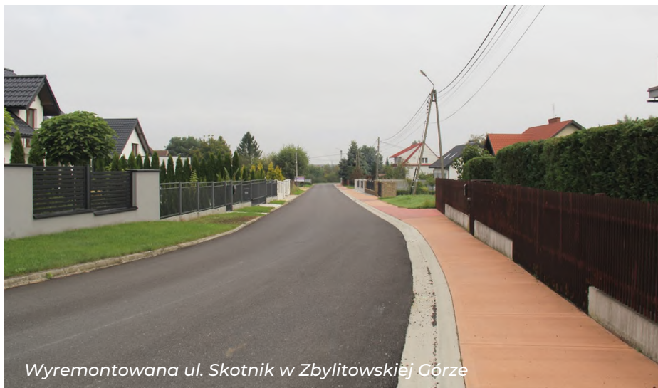
Wyremontowana ul. Skotnik w Zbylitowskiej Górze

Wysokie dofinansowania z Rządowego Programu Przeciwdziałania Covid-19 umożliwiają kontynuowanie rozpoczętych już inwestycji. W Woli Rzędzińskiej I wsparcie rozbudowy Szkoły Podstawowej o halę sportową i segment dydaktyczny wyniosło 4 mln zł, w Łękawce dofinansowanie