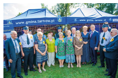
Wola Rzędzińska II