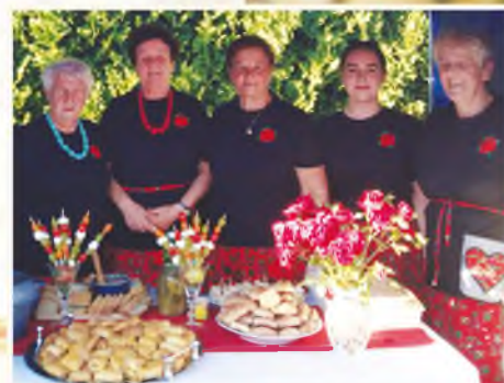
KGW w Tarnowcu