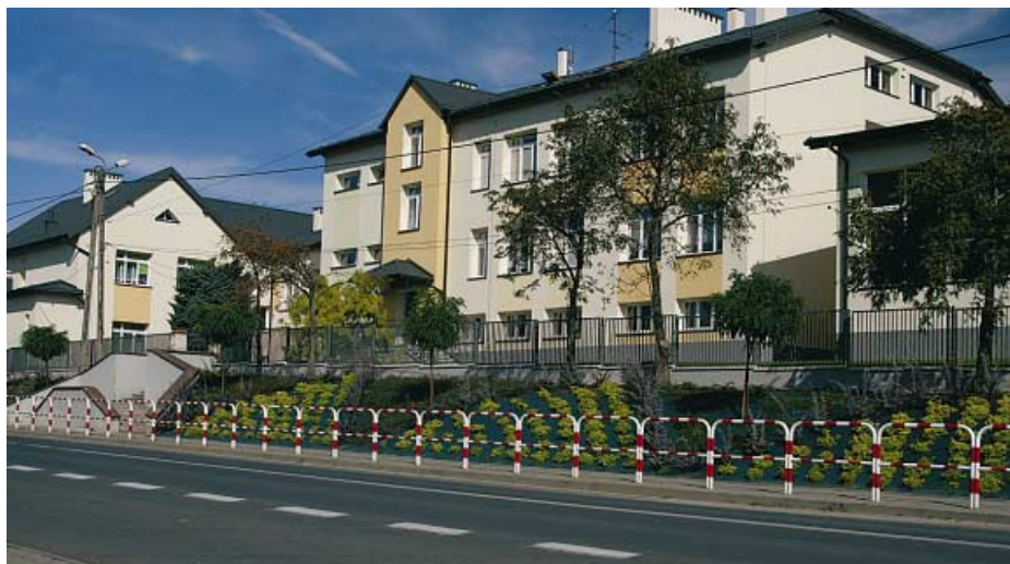
Tarnowiec. Zespół Szkół Publicznych po modernizacji.

Przedstawiona „wyliczanka” to ważne, choć niejedynie inicjatywy z zakresu gospodarki komunalnej. Przykłady prac zrealizowanych w ciągu ostatnich czterech lat można by bowiem mnożyć – niektóre z nich zostały krótko zaprezentowane na wstępie. Wymieniać jednak można jeszcze wiele zrealizowanych zadań, a wszystkie dotyczą ważnych dla mieszkańców spraw: remont kapliczki na cmentarzu wojennym, zjazd ze szkoły, parking, odwodnienie ul. Na Wał w Tarnowcu, zlecenie projektu garażu dla OSP w Łekawce, przygotowanie projektu kaplicy cmentarnej w Tarnowcu i wiele innych, również i tych przewidzianych do realizacji w kolejnych latach.