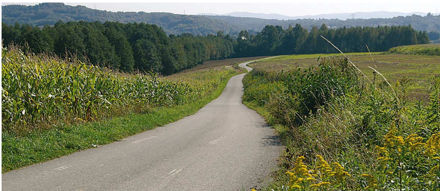
Droga transportu rolnego w gminie Tarnów.