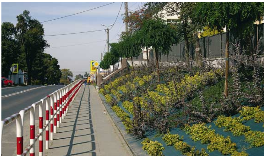
Tarnowiec. Zagospodarowanie zieleni wokół Zespołu Szkół Publicznych.