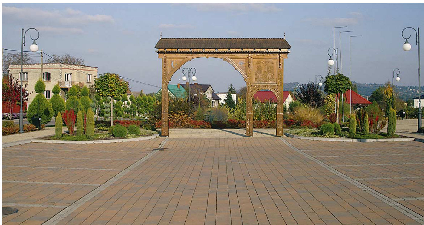
Koszyc Wielkie. Centrum wsi z bramą seklerską.