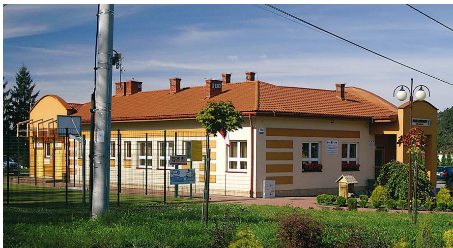
Nowodworek. Zagospodarowanie terenu wokół Domu Ludowego.

Jednym z ważnych elementów działalności socjalnej gminy są programy profilaktyczne. W trakcie minionej kadencji każdego roku jesienią dla osób, które przekroczyły 65 rok życia realizowane są programy bezpłatnych szczepień przeciwko grypie. Realizowane były także programy profilaktyki nowotworowej: dla kobiet – mammografia, dla mężczyzn – badania w kierunku wczesnego wykrywania raka prostaty. Ich adresatami byli mieszkańcy po czterdziestym piątym roku życia.