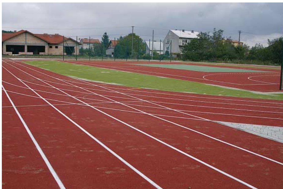
Wola Rzędzińska. Kompleks sportowy i budowa przedszkola.

W ramach realizowanych inwestycji przeprowadzono także remonty budynków. Modernizacji doczekał się budynek