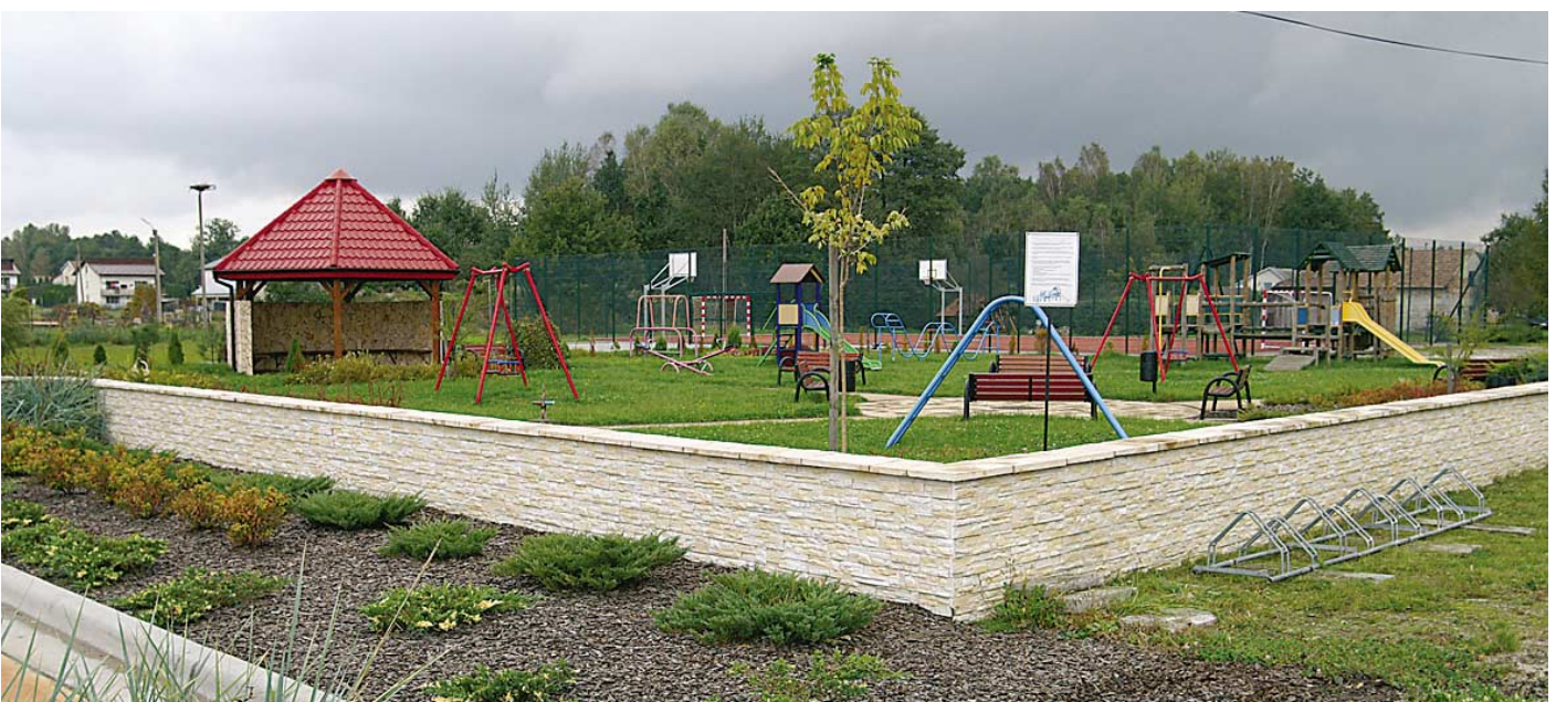
Jodłówka-Wałki. Centrum wsi z placem zabaw.

budżetu. Większość z nich pochodziła z programów unijnych – przede wszystkim Programu Rozwoju Obszarów Wiejskich. Duża część trafiła do gminy dzięki jej uczestnictwu w Lokalnej Grupie Działania – Stowarzyszeniu Zielony Pierścień Tarnowa, które współtworzy i którego jest aktywnym członkiem. Poza tym pieniądze pozyskiwane były z dostępnych programów krajowych Ministra Sportu i Turystyki, Narodowego Funduszu Ochrony Środowiska, Samorządu Województwa Małopolskiego, Narodowego Programu Budowy Dróg Lokalnych. A zważywszy na wielkość gminnego budżetu, ponad 50 milionów złotych pozyskanych środków to prawie rok rozwoju gratis.