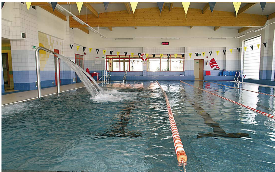
Wola Rzędzińska. Basen szkolno-rehabilitacyjny.