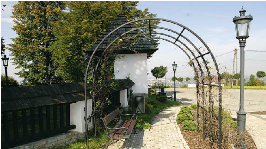
Zawada. Centrum miejscowości w otoczeniu zabytkowego kościoła św. Marcina.

Mimo że w ostatnich latach dał się odczuć kryzys gospodarczy, to jednak dochody cały czas rosły, a więc kryzys nie wpłynął na pogorszenie się stanu finansów gminy. Dzięki temu samorząd posiada możliwość finansowe do zapewnienia wkładu własnego na realizację zadań inwestycyjnych opartych na współfinansowaniu z programów i projektów Unii Europejskiej np. w ramach Programu Rozwoju Obszarów Wiejskich.