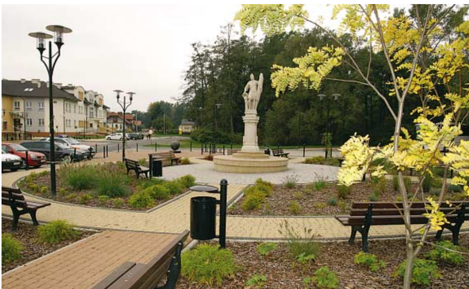
Zbylitowska Góra. Centrum wsi - plac św. Floriana.