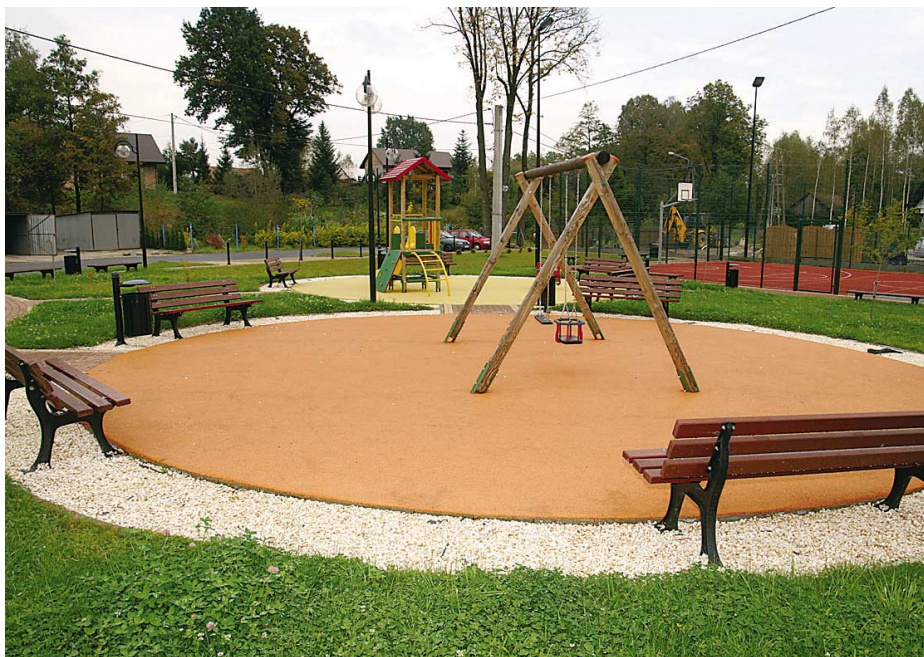
Koszycy Małe. Centrum miejscowości z placem zabaw i boiskiem wielofunkcyjnym

Wśród inwestycji należy wymienić również te, których realizacja wynika z troski o zachowanie dziedzictwa kulturowego. W najcenniejszym zabytku gminy Tarnów – XVI-wiecznym drewnianym kościele pw. św. Marcina w Zawadzie