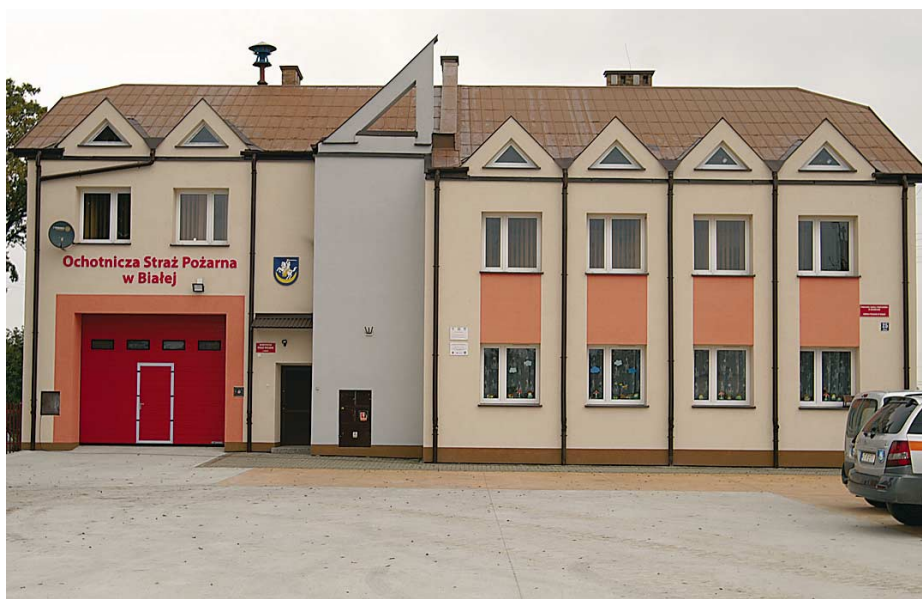
Biała. Remiza OSP po modernizacji.

Modernizacja remiz w Białej, Porębie Radlnej i Woli Rzędzińskiej. Nowe bramy garażowe zostały zakupione do remiz w Koszycach Małych, Jodłowce-Wałkach. Wykonaniem projektu rozpoczęła się także inwestycja budowy garażu dla OSP w Łekawce. Na wszystkie te działania wydatkowano ponad 600 tysięcy, z czego 130 tysięcy to pieniądze pozyskane z programu Urzędu Marszałkowskiego Województwa Małopolskiego „Małopolskie Remizy”, zaś ponad 110 tysięcy to środki pochodzące z Wojewódzkiego Funduszu Ochrony Środowiska. Po przejściu remizy w Zgłobicach trwają prace nad projektem i przygotowania do modernizacji ostatniej już niewyremontowanej remizy na terenie gminy.