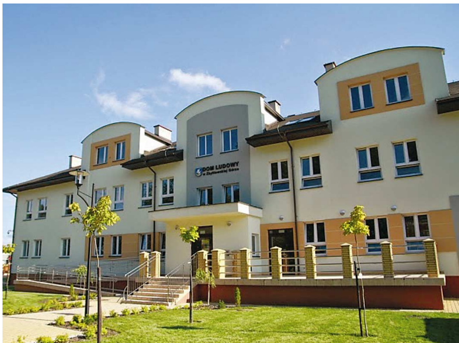
Zbylitowska Góra. Dom Ludowy.

Wybudowanie nowych boisk wielofunkcyjnych, hali sportowej, sal gimnastycznych, basenu, utworzenie siłowni – jednym słowem całemu temu rozwojowi bazy sportowej, jaki nastąpił w ciągu ostatnich lat, towarzyszy nie tylko wzrost u młodych ludzi chęci do uprawiania sportu, ale także i konkretne wyniki. Z opublikowanego pod koniec czerwca sprawozdania z działalności Powiatowego Szkolnego Związku Sportowego za rok szkolny 2013/2014 wynika, że szkolni sportowcy z gminy Tarnów są najlepsimi w całym powiecie tarnowskim. Sportowców tych wspiera gminne Centrum Animacji Kulturalnej, organizując cykliczne zawody sportowe o Puchar Wójta w dyscyplinach, takich jak pływanie, narciarstwo, tenis, szachy, piłka nożna czy siatkówka plażowa. Rozwijają się także gminne kluby sportowe – LKS-y i UKS-y, których działalność każdego roku gminny samorząd wspiera finansowo kwotą około 400 tysięcy złotych.