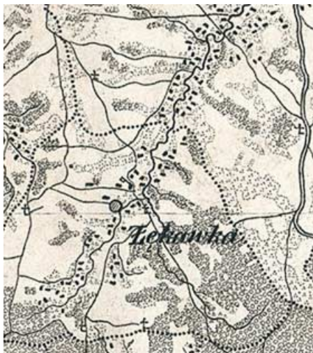
Łękawka na mapie z 1855 r.