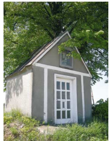
Kapliczka NSPJ w Łękawce.