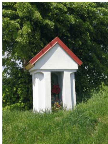
Kapliczka św. Jana Nepomucena w Łękawce.