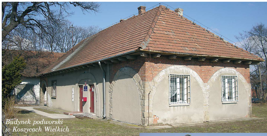
Budynek podworski w Koszycach Wielkich