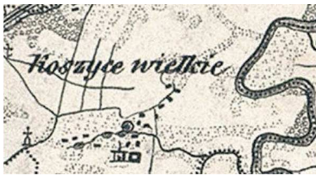
Koszyce Wielkie na mapie z 1855 roku

Przejeżdżających południową obwodnicą Tarnowa z oddali wita okazała sylweta kościoła parafii pw. Przemienienia Pańskiego obejmującej Koszyce Wielkie. W pobliżu tej pięknej wizytówki miejscowości przebiega północna granica tego sołectwa. Do 1960 roku sięgała ona znacznie dalej, aż do ul. Krakowskiej. W latach 1782-1914 nad Białą, jeszcze wtedy w Koszycach Wielkich, był przetrucyony drewniany kryty most, będący w swoim czasie przykładem kunsztu inżynierijnego wysokiej próby.