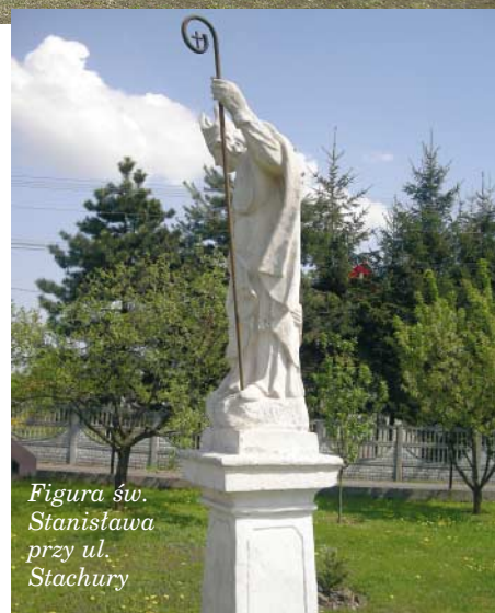
Figura św. Stanisława przy ul. Stachury

Nie wiemy, kiedy Koszyce Wielkie przeszły od Rokoszków w inne ręce. Z XVIII stulecia pochodzą dwa najstarsze zabytki miejscowości - barokowe figury św. Jana Nepomucena i św. Stanisława Biskupa. W 1830 roku Koszyce Wielkie wymienione zostały jako własność księcia Władysława Sanguszki z podtarnowskich Gumnisk. Według Słownika geograficznego Królestwa polskiego w 1883 roku liczyły 566 mieszkańców rzymskich katolików, z tych 125 na obszarze większej własności Sanguszków i posiadały kasę pożyczkową gminną z funduszem 195 zł. Posiadłość większa, czyli należąca do Sanguszków wy-