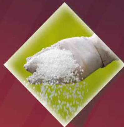
Nawozy sztuczne i mineralne