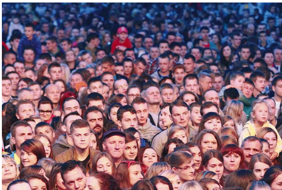
Ubiegłoroczny koncert charytatywny zgromadził tłumy. Na powtórzenie tego sukcesu organizatorzy liczą również i w tym roku.

- W bieżącym roku zaprosimy mieszkańców zarówno na zupełnie nowe wydarzenia, jak i te, które już dobrze znają. Lecz każdy z festynów postaramy się ulepszyć, by zawsze