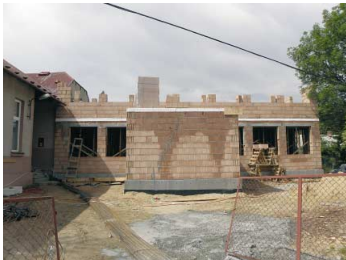
Jodłówka-Watki - rozbudowa szkoły

działania „Odnowa i rozwój wsi” z PROW to ok. milion złotych. Z kolei w ramach działania „Małe Projekty” za 21 tysięcy złotych realizowany jest także remont XIX-wiecznej kapliczki.