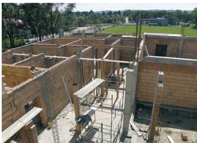
Koszyce Małe - budowa sali gimnastycznej