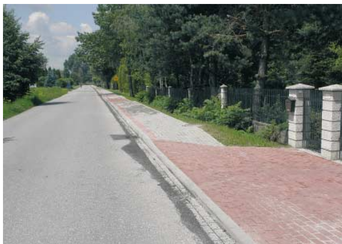
Tarnowiec - ścieżka rowerowa przy ul. Na Młyny

Kontynuowana będzie budowa przedszkola. Ponadto obok przedszkola powstaje kompleks sportowy składający się z wielofunkcyjnego boiska ze sztuczną nawierzchnią, bieżni oraz bieżni do skoku w dal. Wartość inwestycji finansowanej w połowie w ramach