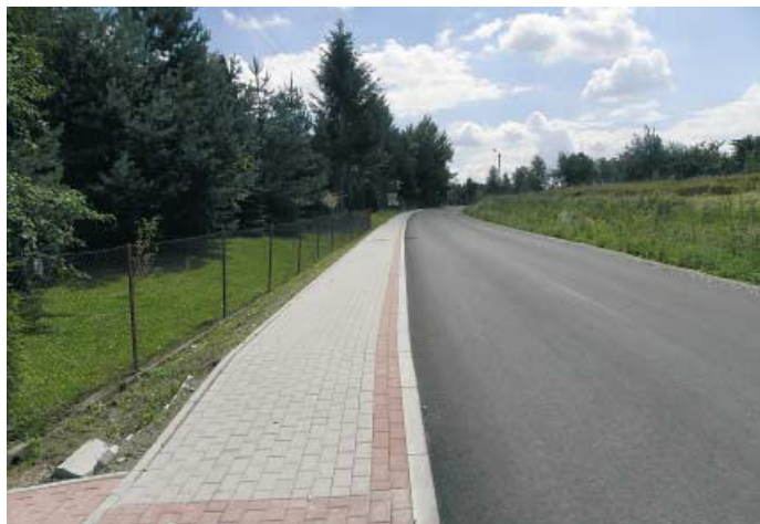
Łękawka - ścieżka rowerowa przy drodze powiatowej

Najważniejszą i praktycznie już zrealizowaną inwestycją jest budowa ścieżki rowerowej w kierunku DPS. Ścieżka o długości 1,5 kilometra i szerokości 1,5 metra, wraz z kanalizacją opadową, została wykonana w technologii betonowej. Wartość inwestycji