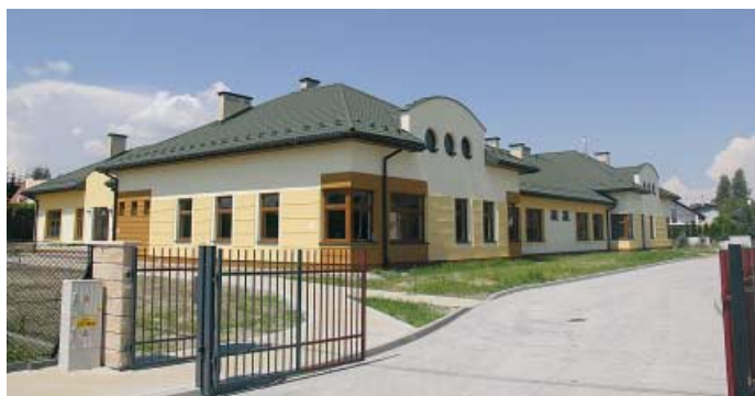
Zgłobice - budowa przedszkola