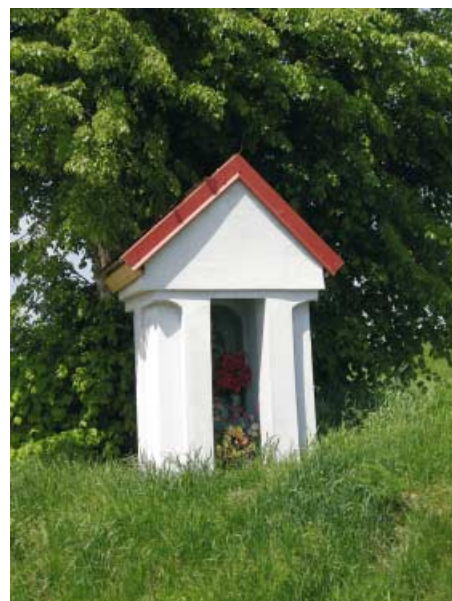
Kapliczka św. Jana Nepomucena Łękawka z 1869 roku.

Zycie Łękawki w znacznym stopniu koncentruje się wokół szkoły podstawowej, dzisiaj jedynej instytucji oświatowej i kulturalnej we wsi. Rozpoczęła ona działalność w 1902 roku z inicjatywy Rady Gminy w Łękawce, początkowo jako klasa nadetatowa szkoły w Porębie Radlnej, a od następnego roku jako szkoła samodzielna. Początki szkoły były