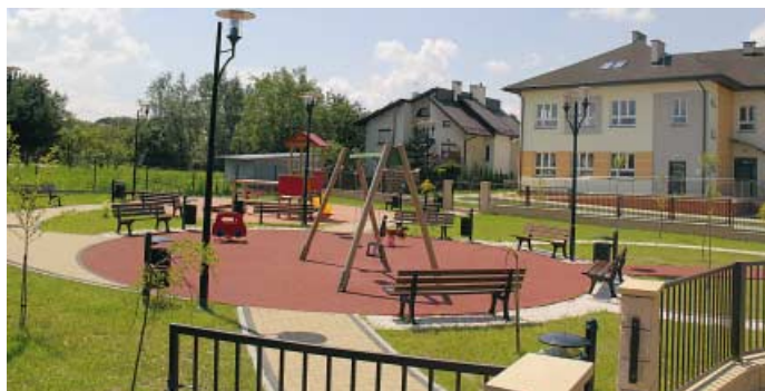
Zbylitowska Góra - plac zabaw