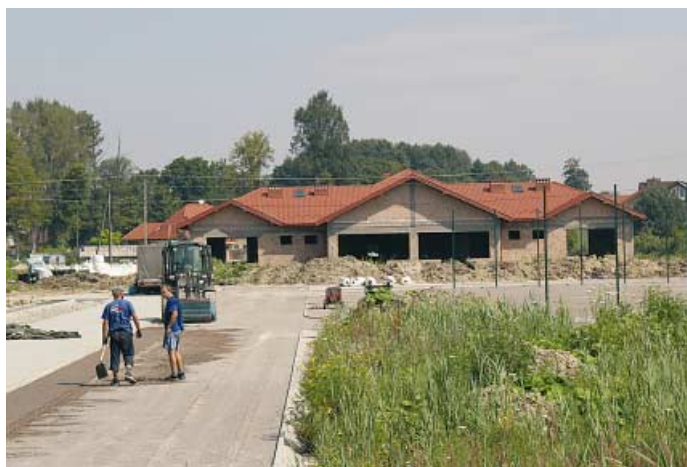
Wola Rzędzińska I - budowa przedszkola i boiska wielofunkcyjnego