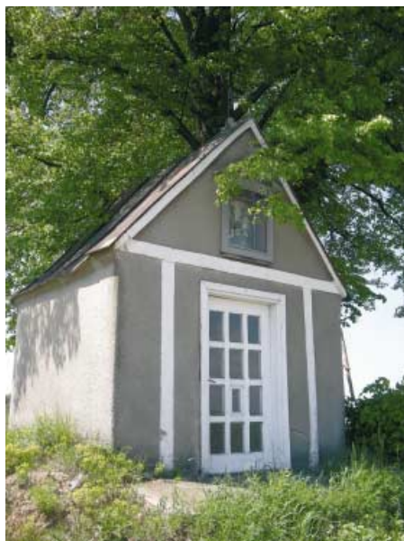
Kapliczka NSPJ w Łękawce.

Pod względem administracji kościelnej Łękawka należała od swoich początków do parafii w odległej o cztery kilometry Porębie Radlnej. Tutejsi pobożni mieszkańcy ufundowali pod koniec XIX wieku kapliczkę domkową przy drodze wojewódzkiej nr 977 z Tarnowa do Tuchowa, przy granicy