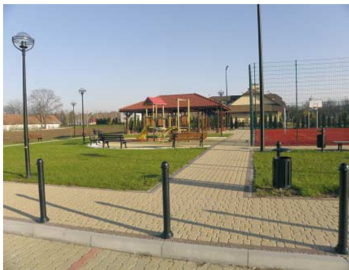
Radlna - centrum wsi