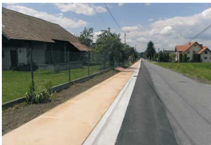
Nowodworze - chodnik przy drodze do DPS-u