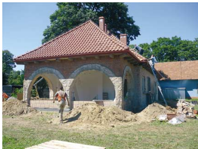
Koszyce Wielkie - remont budynku przy ul. Pocztowej